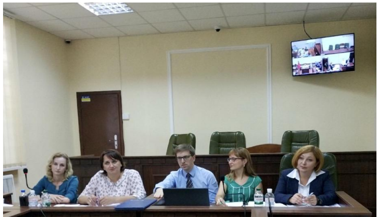
Засідання конкурсної комісії ВАКС, липень 2019

Крім того, з метою забезпечення прозорості, відкритості та ефективності добору персоналу, який відповідатиме високим стандартам та матиме належну кваліфікацію, в якості спостерігачів до роботи конкурсної комісії було залучено представників міжнародних та національних