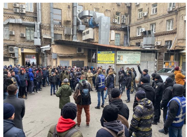
Зібрання біля приміщення ВАКС, вул. Хрещатик, 42-А, листопад 2019

цілісності будівель (приміщень) ВАКС, забезпечення безпеки суддів, працівників апарату ВАКС, учасників судового процесу та безпеки під час судових засідань;