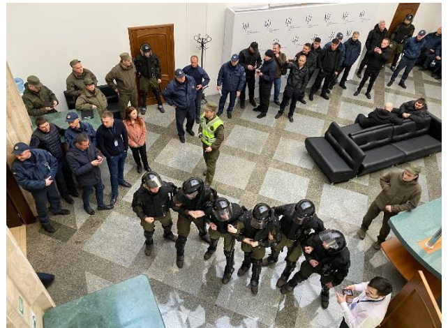
Спільні практичні тактико-спеціальні заняття підрозділів ТУ ССО, НГУ, ГУНП у місті Києві, березень 2020