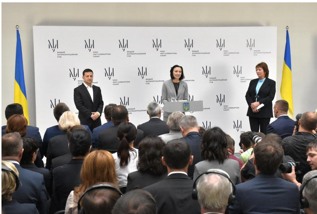
Відкриття ВАКС. 05.09.2019

На виконання вимог Закону України «Про державну службу» за результатами проведення оцінювання службової діяльності державних службовців Державною судовою адміністрацією України за результатами діяльності у 2019 році роботу керівника апарату Вищого антикорупційного суду оцінено на «відмінно».