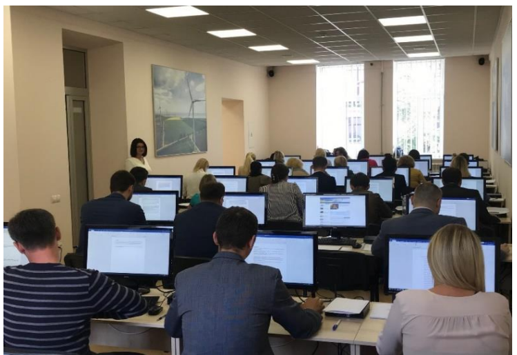
Тестування кандидатів на посади державних службовців, липень 2019

Персонал апарату ВАКС систематично підвищує свою професійну кваліфікацію в закладах освіти (очно та дистанційно), які мають право надавати відповідні освітні послуги, серед них Національна школа суддів України, Українська школа урядування. Також значне місце в навчанні працівників апарату ВАКС займають освітні е-платформи Prometheus, Edera, Дія Цифрова освіта, освітній хаб міста Києва та інші. Крім того, працівники проходили навчання з питань роботи в АСДС «Д-3» Професійної мережі «Феміда», які проводило ДП «Інформаційні судові системи».