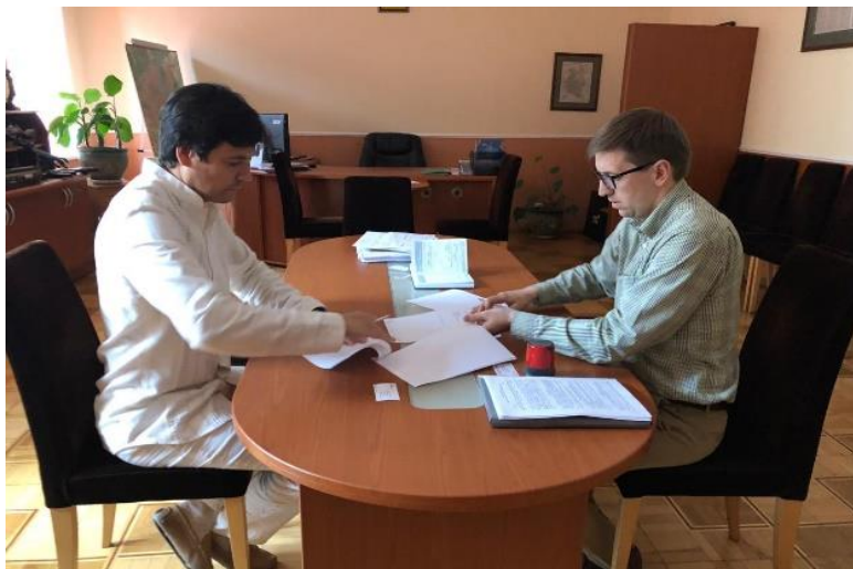
Підписання договору із РВ ФДМ щодо оренди приміщення за адресою просп Перемоги, 41, 05.07.2019

У ході офіційного листування з'ясовано, що власник будівлі по просп. Перемоги, 41 у м. Києві, Державне підприємство «Антонов», заперечує можливість безоплатної передачі приміщення ВАКС у зв'язку із заборгованістю