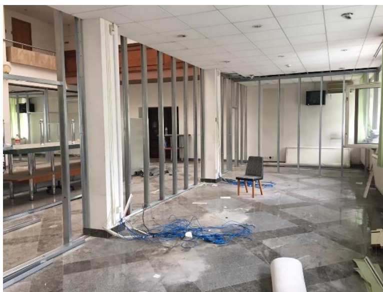
Стан «до» ремонту, зал с/з №6.