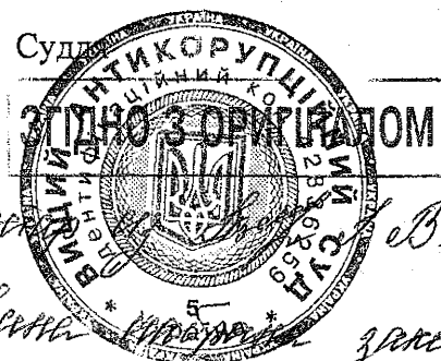
Д. Г. Михайленко

Враховуючи, що інших перешкод для призначення до розгляду апеляційної скарги на ухвалу суду від 18.12.2019 на етапі прийняття цієї скарги не виявлено, то слід призначити розгляд клопотання захисника про поновлення строку на апеляційне оскарження, повідомити про його час, дату та місце учасників судового провадження. Ухвала оскарженню не підлягає. Виконано: 04.02.2020